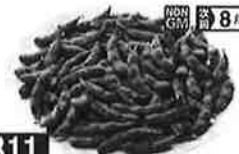
311 北海道産塩味えだまめ

冷凍ときくと生で食べるより味が落ちるのでは...？ とずっと思っていた私ですが、この枝豆、ほんとうに とっても美味しいです。息子たちは1袋を取り合い 食べる程... (笑) 秋の行楽のお供にぜひ!!